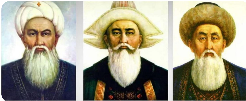
Төле би. Қазыбек би. Әйтеке би.

Халқыңа адал бол, Жауыңа қатал бол, Досыңа адал бол!