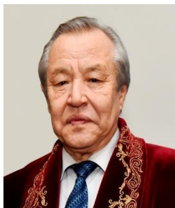
Мейірхан АҚДӘУЛЕТҰЛЫ, ақын